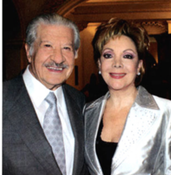
Ignacio López Tarso y Jacqueline Andere