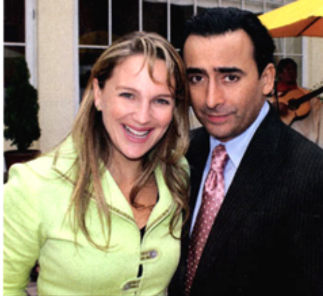
Luciana León y Adal Ramones